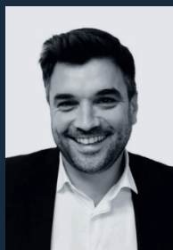
J. MICHEL SOFA