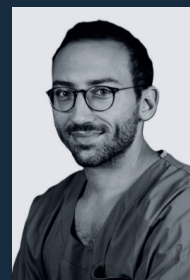
T. RADULESCO SOFA